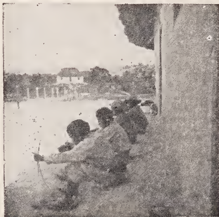
Típico modo de pescar con flecha en la Gran Sabana.

También yo me retiré. Más la figura de aquel nuevo Don Quijote con el hacha en mano, que no podía apartar de mi imaginación, no me dejaba dormir. Y en mis oídos resonaban, pero dirigidos ahora contra él, aquellos “amables” epítetos que todos habían lanzado contra el negrito. Y sin embargo, el buen hombre, al fin y al cabo, fué un héroe. No tuvo miedo a la hiena. . . Y con este pensamiento más caritativo me dormí de nuevo.